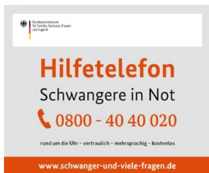
AUFKLEBER Artikelnr.: 4SO206